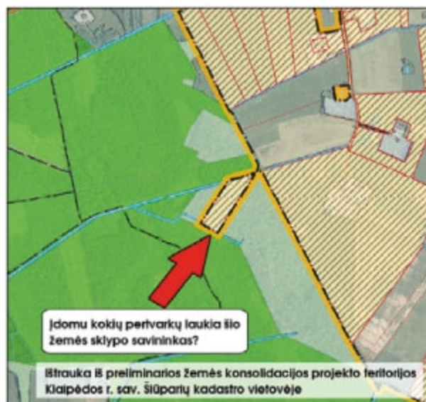
Paveikslas Nr. 2. Įdomu kokių pertvarkų naujame finansavimo periode laukia žemės savininkas kuris į preliminarią žemės konsolidacijos projekto teritoriją Klaipėdos r. sav. Šiūparių kadastro vietovėje įtraukė žemės sklypą „apendicitą“?

galėjo visą laisvą valstybinę žemę pagal NŽT (arba organizatoriaus) pageidavimą sukelti į vieną didelį patrauklų žemės sklypą arba panaudoti žemės reformos klaidoms taisyti. Taip pat papildomai prie kiekvieno laisvos valstybinės žemės sklypo, susidariusio iš rasto viršpločio, reikėjo formuoti servitutus, kad būtų galima privažiuoti prie šio sklypo. Be to tai prisidėjo prie projekto teritorijos fragmentiškumo.