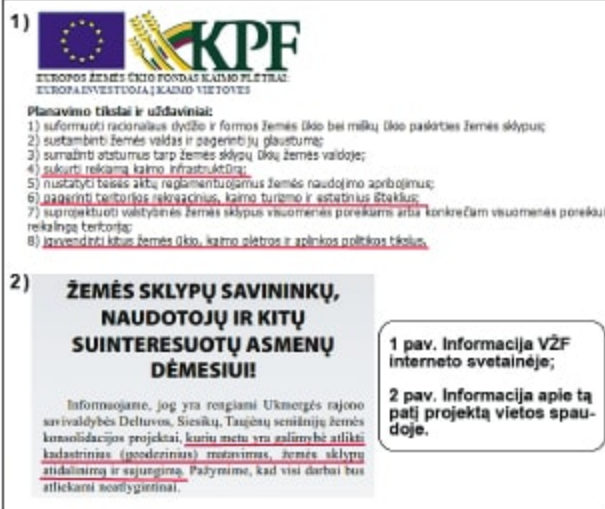
Paveikslas Nr. 3. Vietos spaudoje atskleidžiama kas iš tiesų vykdoma per žemės konsolidacijos projektus

siškai nesutvarkyta konsolidacijos projektų rengimo ir įgyvendinimo įstatymų baze einama tik pasipinigauti, t.y. atliekant tikslus žemės sklypų kadastrinius matavimus tose pačiose žemės sklypų ribose, kitaip tariant vykdant riboženklių renovacijos projektą.